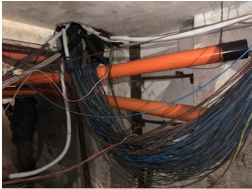
Nuova protezione in appartamento