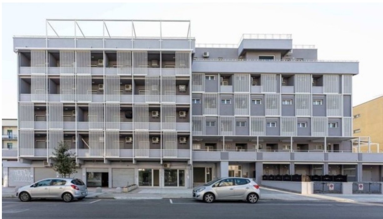
Condominio MODERNO – viale Pascoli, 14 – 44029 LIDO DEGLI ESTENSI (FE)